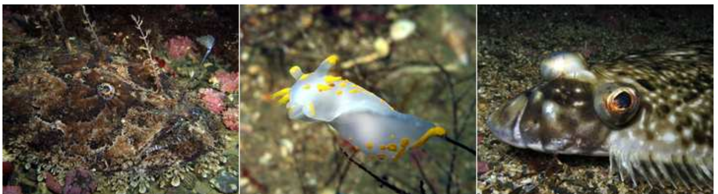
I Altafjorden denne vinteren: Breiflabb, Polycera quadrilineata og kveite.

NB! Ny lov for Alta Dykkerklubb, vedtatt på årsmøtet 9. februar, godkjent av Finnmark Idrettskrets 9. mars 2007, ligger klar til nedlasting på klubbens webside www.altadykkerklubb.com under dokumentbibliotek.